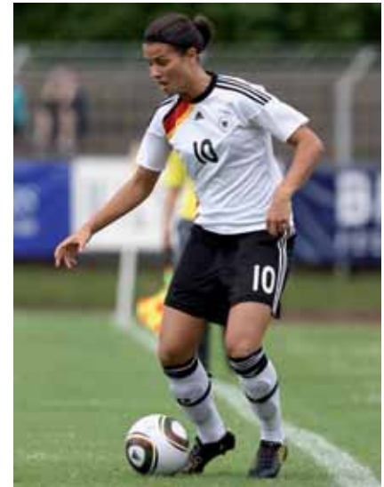
Engagiert für den Nachwuchs: Dszenifer Marozsan

Die Mädchen des Städtischen Gymnasiums aus Gütersloh qualifizierten sich in ihrer Gruppe mit drei Siegen gegen das Warndt-Gymnasium aus Völklingen (2:1), das Sportgymnasium Neubrandenburg (2:0) und das Otto-Hahn-Gymnasium aus Karlsruhe (3:1) überlegen für das Viertelfinale. Mit einem 2:1 Sieg gegen das Max-Planck-Gymnasium aus Trier erreichten die Mädchen das Halbfinale. Dort verloren sie gegen den späteren Sieger, die Poelchau-Oberschule aus