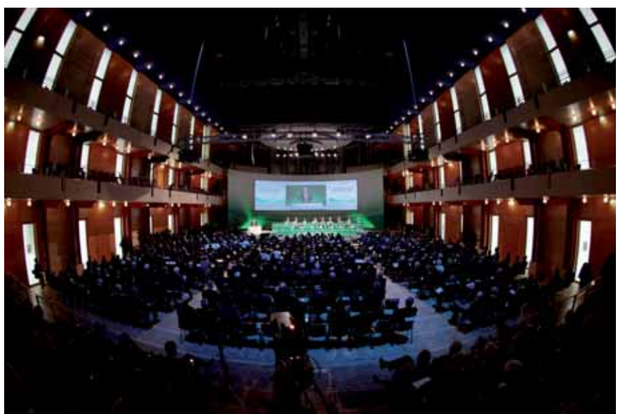
Das Ambiente in der Essener Philharmonie war perfekt

Zum Abschluss entschieden die 255 Delegierten, dass der 41. Ordentliche DFB-Bundestag 2013 in Nürnberg stattfinden wird. Zuvor stehen noch einige Großereignisse wie etwa die WM der Fußball-Frauen 2011 in Deutschland auf dem Programm. Drei Spielorte – Bochum, Mönchengladbach, Leverkusen – sind in unmittelbarer Nachbarschaft der Essener Philharmonie.