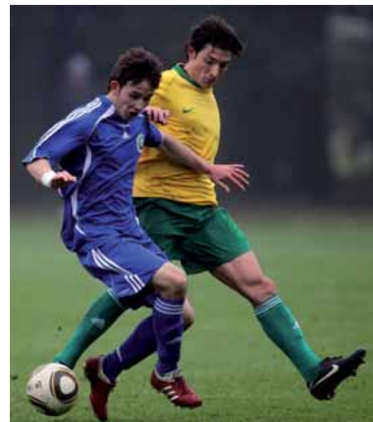
Ein packendes Finale: Der Niederrhein unterlag im Duell gegen den Mittelrhein