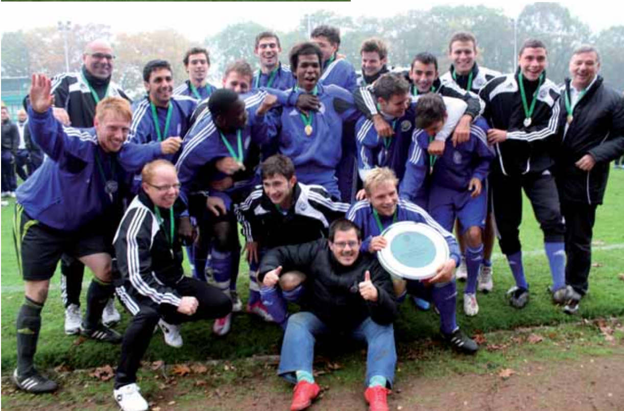
Die Freude ist angebracht: Die U 21-Herren des Fußball-Verbandes Mittelrhein überzeugten – und siegten – beim DFB-Länderpokal.