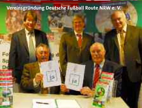
Vereinsgründung Deutsche Fußball Route NRW e. V.