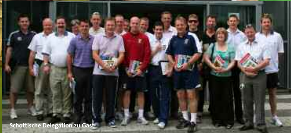
Schottische Delegation zu Gast