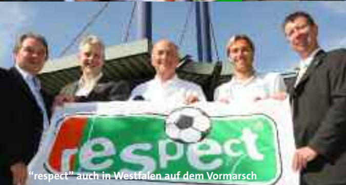
"respect" auch in Westfalen auf dem Vormarsch