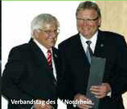
Verbandstag des VfV Nordrhein