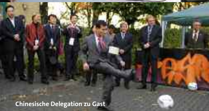
Chinesische Delegation zu Gast