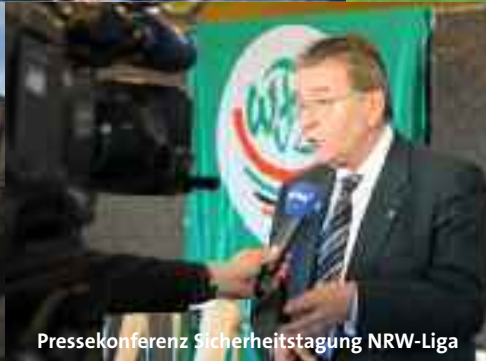
Pressekonferenz Sicherheitstagung NRW-Liga