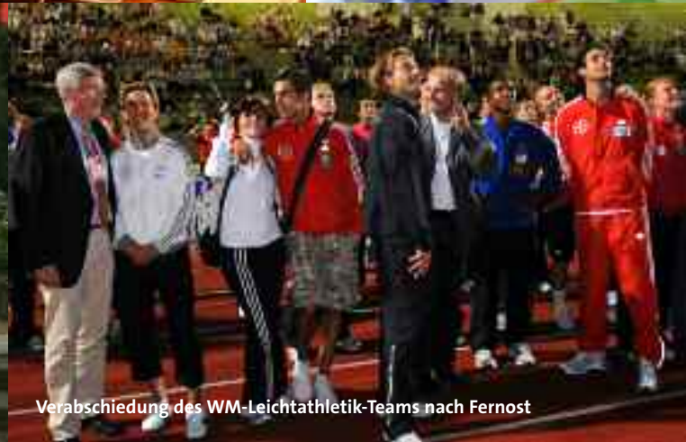
Verabschiedung des WM-Leichtathletik-Teams nach Fernost