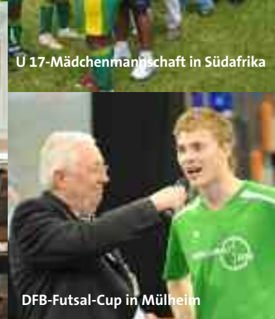
DFB-Futsal-Cup in Mülheim