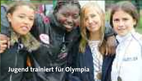
Jugend trainiert für Olympia