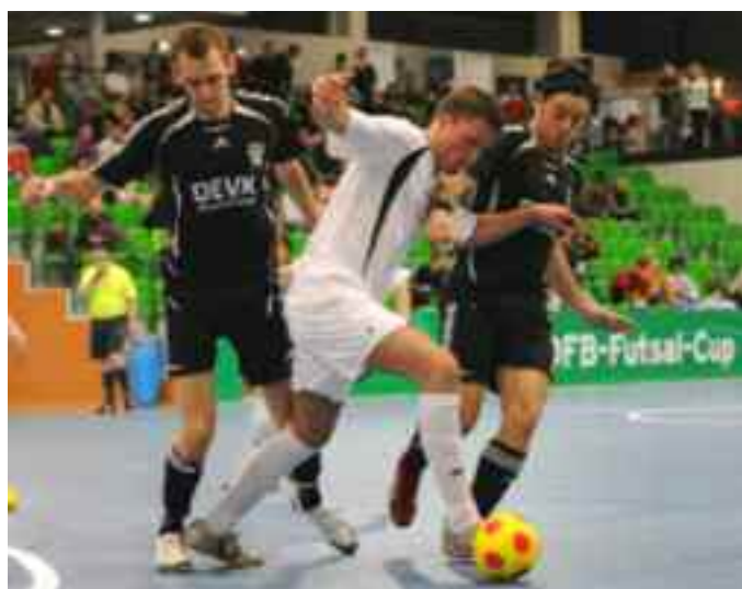
UFC Münster (in schwarz) beim DFB-Futsal-Cup