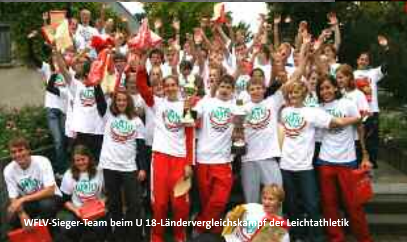
WFLV-Sieger-Team beim U 18-Ländervergleichskampf der Leichtathletik