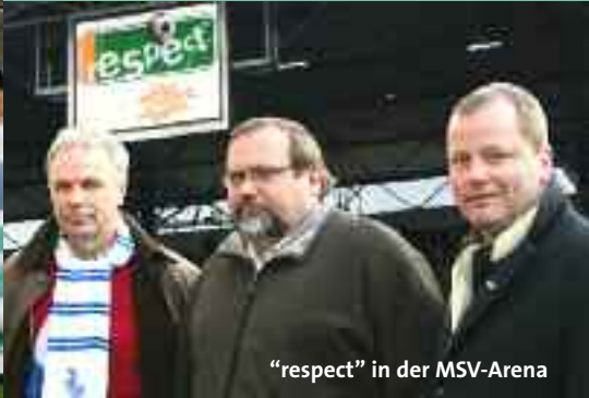
"respect" in der MSV-Arena