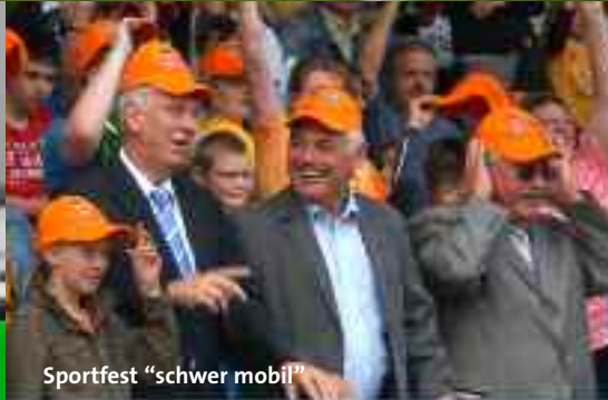
Sportfest "schwer mobil"