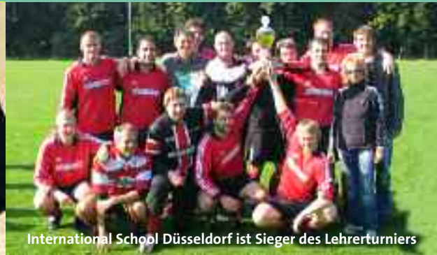
International School Düsseldorf ist Sieger des Lehrerturniers