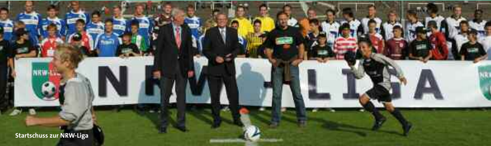
Startschuss zur NRW-Liga