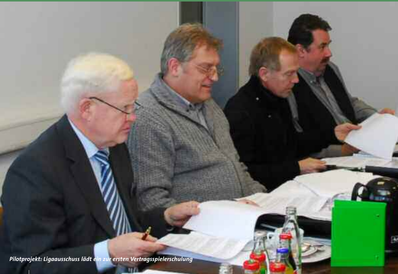
Pilotprojekt: Ligaausschuss lädt ein zur ersten Vertragsspielerschulung