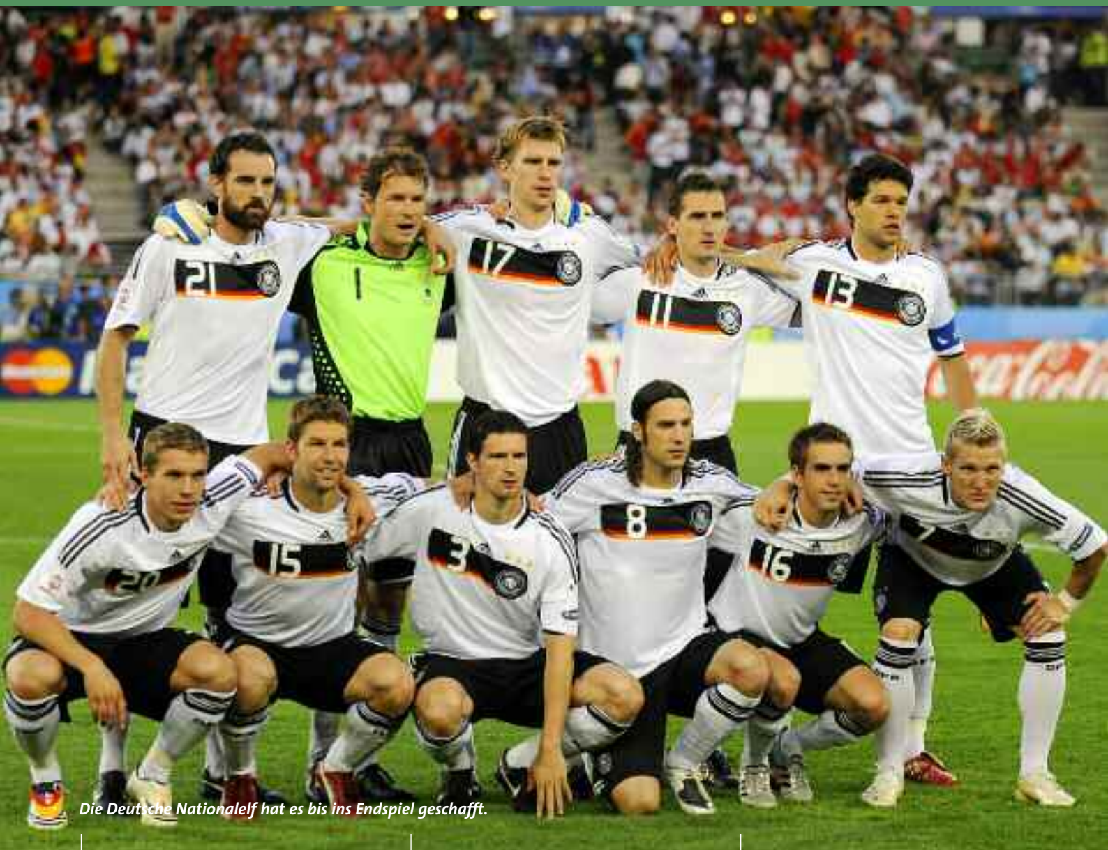
Die Deutsche Nationalelf hat es bis ins Endspiel geschafft.