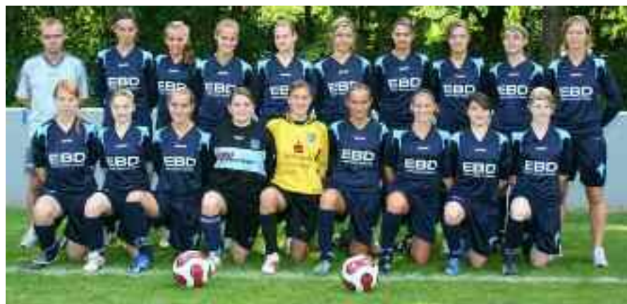
Siegermannschaft: FCR 2001 Duisburg