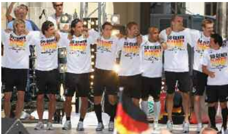
Die Nationalmannschaft wurde auf der Fanmeile in Berlin ausgiebig gefeiert

Um 14 Uhr war die deutsche Mannschaft mit dem Flieger in Berlin-Tegel gelandet. Vom Flughafen aus ging es mit einer Polizei-Eskorte direkt zum Brandenburger Tor. Die Hamburger Band "Revolverheld" leitete mit ihrem EM-Song "Helden 2008" den Aufmarsch der Spieler ein. Die österreichische Pop-Sängerin Christina Stürmer steuerte ihren EM-Song "Fieber" bei.