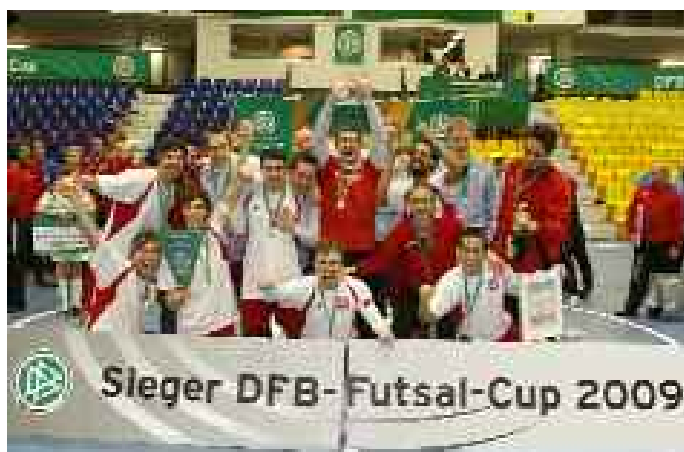
Die Futsal Panthers aus Köln holen sich den DFB Futsal Cup 2009.