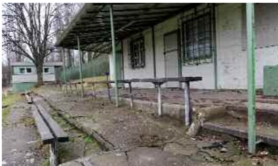
Marode Sportstätten - leider keine Seltenheit!

Mit einem aus vier spezifischen Arbeitskreisen, den Sie bei Anmeldung selbst festlegen, sichern wir den Schwerpunkt Ihres Interesses ab! Die Sportanlagen werden durch Begehung vor Ort, Produktdemonstration und genügend Diskussionszeit für individuelle Fragen anschaulich und umfassend abgehandelt. Der Finanzierungskreis beinhaltet Tipps zur Antragstellung (NRW-Bank und KfW-Bank), Vorarbeiten zu einer Art