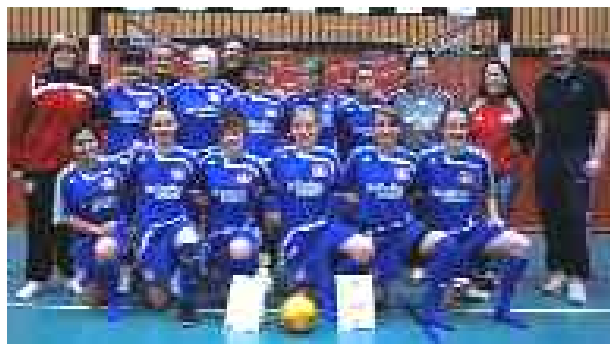
Das Team von Bayer 04 Leverkusen gewinnt den WFLV-Futsal-Cup der U 17-Juniorinnen