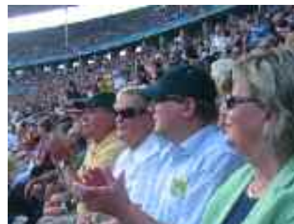
Gute Stimmung im ausverkauften Berliner Olympia-Stadion