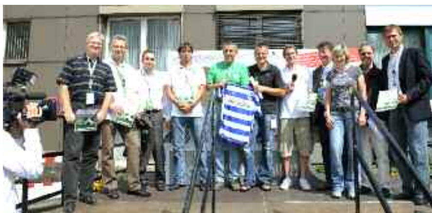
Vorstellung der Teilnehmer am Promi-Kick