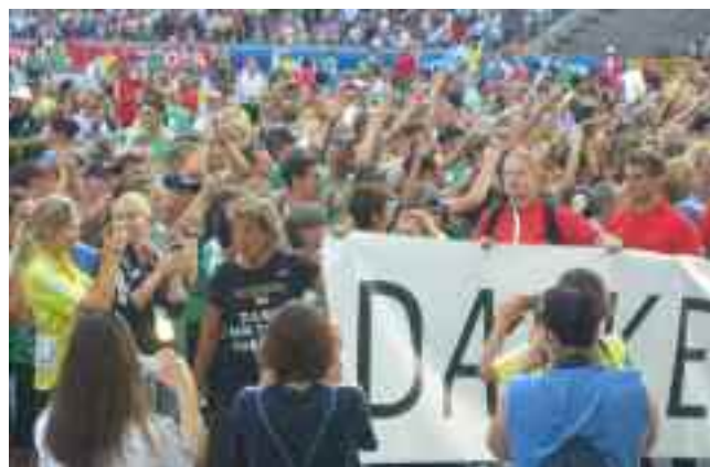
Steffie Nerius bedankte sich nach ihrem ersten Weltmeistersieg bei ihren Fans