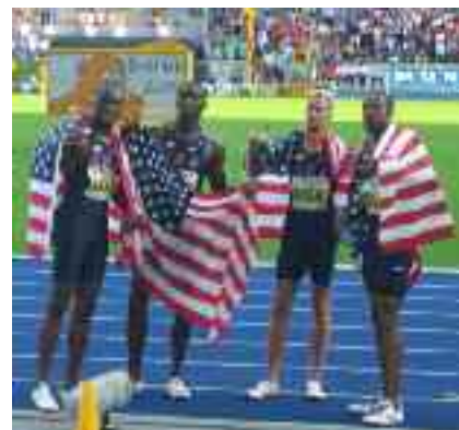
Die siegreiche amerikanische 4 x 400 m Staffel