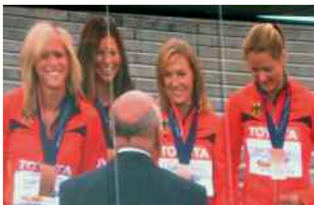
Die deutsche Sprintstaffel der Damen hat sich bei der Leichtathletik-WM in Berlin die Bronzemedaille gesichert