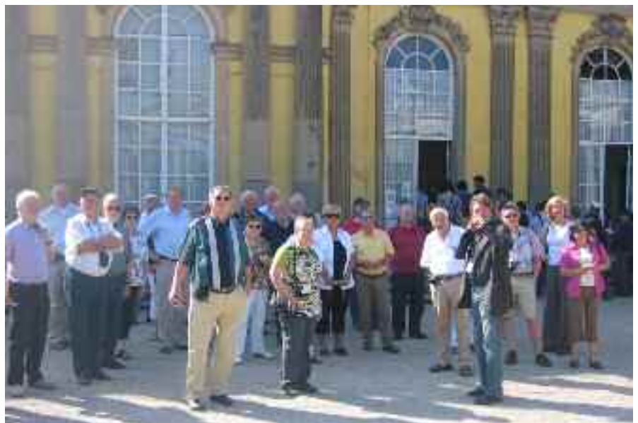
Sport meets Kultur: Preußische Geschichte vor dem Schloss Sanssouci näher gebracht