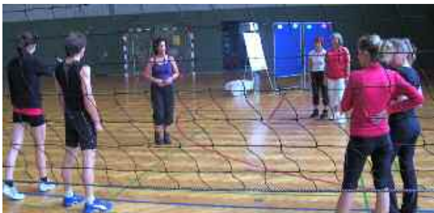
Theorie zum Ausprobieren und Erfahren in der Praxis