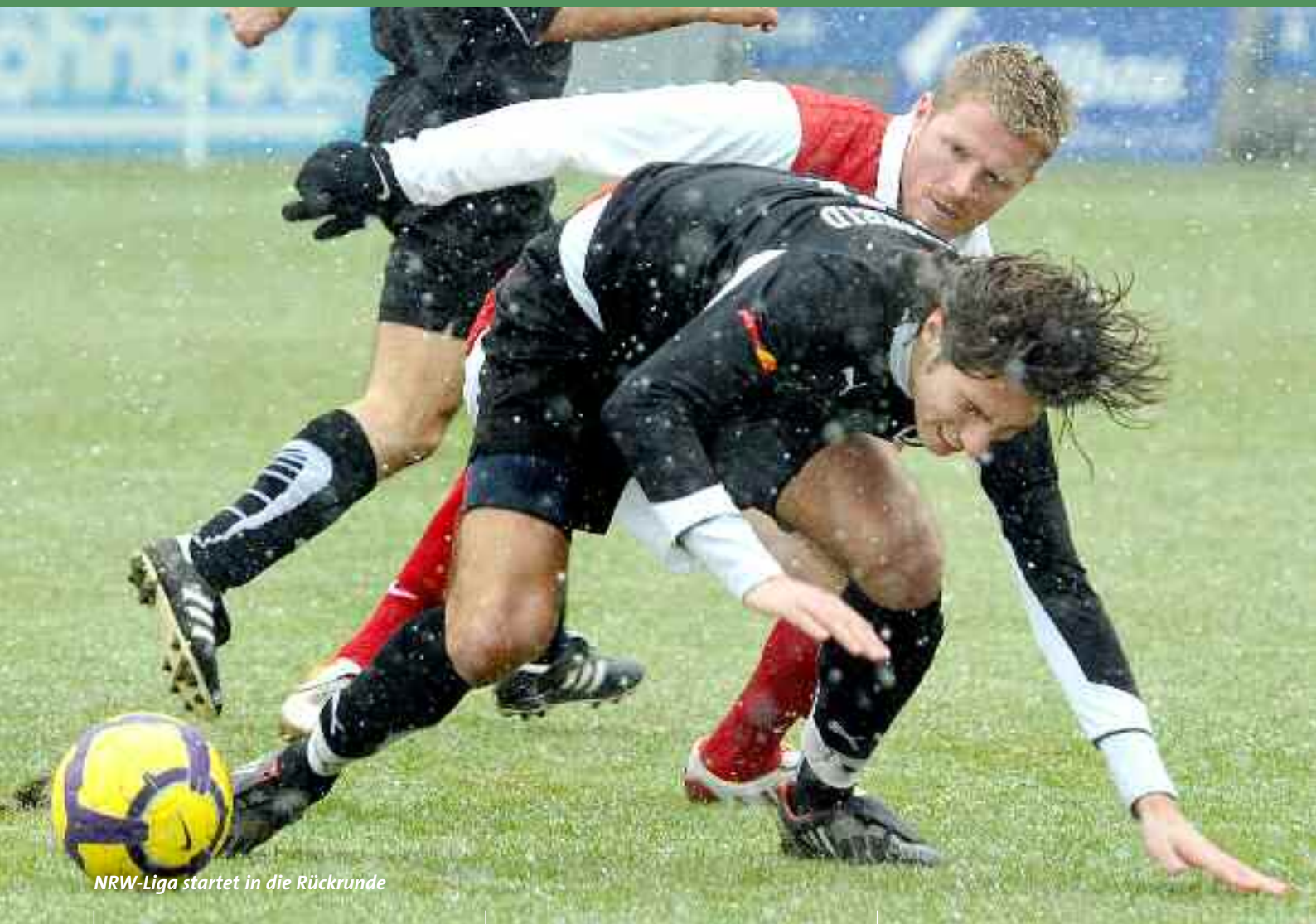
NRW-Liga startet in die Rückrunde