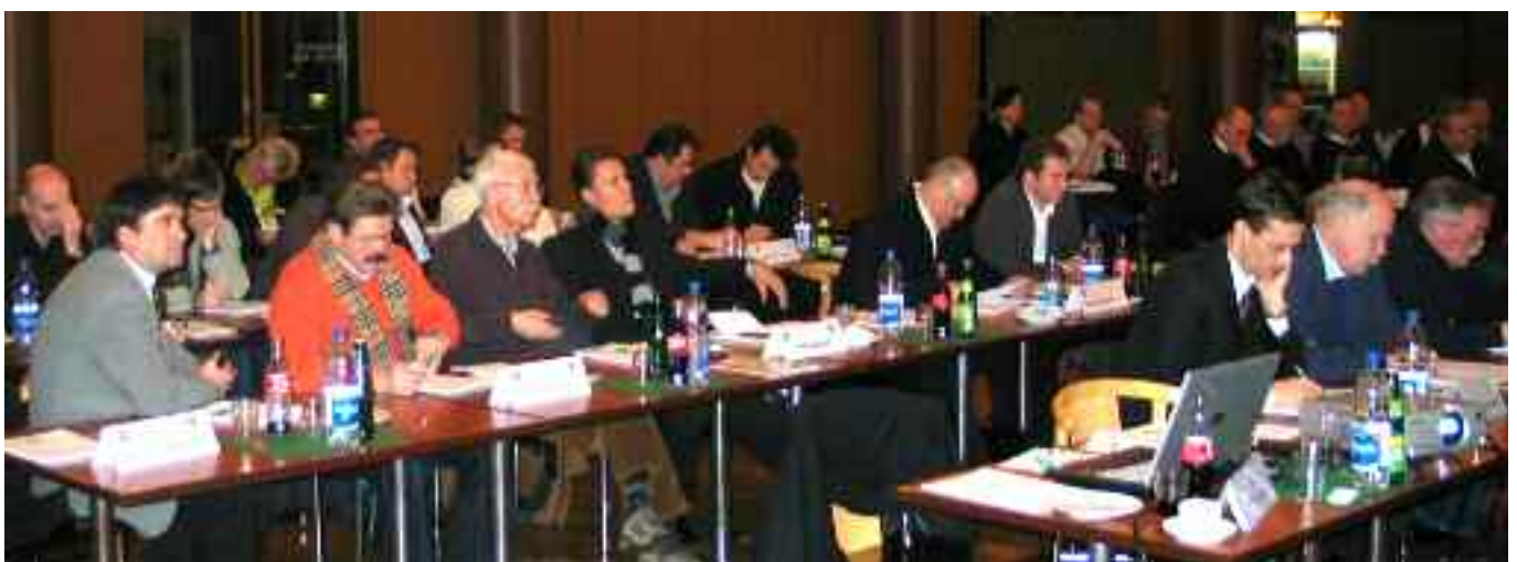
Großes Interesse bei den Vereinsvertretern

Insgesamt wurden bislang 25 Spieler aufgrund einer roten Karte des Feldes verwiesen. Die „gelb-rote Karte“ erhielt