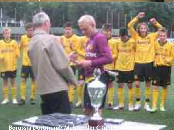
Borussia Dortmund: Meister der C-Junioren