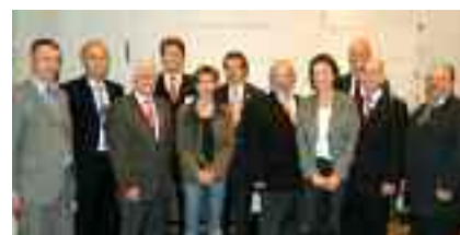
Das neu gewählte DLV-Präsidium

Als sich das Präsidium des Deutschen Leichtathletik-Verbandes (DLV) im November in Berlin für die nächsten vier Jahre neu formierte wurde Dr. Clemens Prokop mit 176 von 187 Stimmen mit einer sehr deutlichen Mehrheit als Präsident wiedergewählt. Er geht damit in seine dritte Amtszeit.