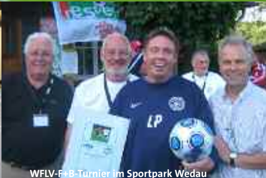
WFLV-F+B-Turnier im Sportpark Wedau