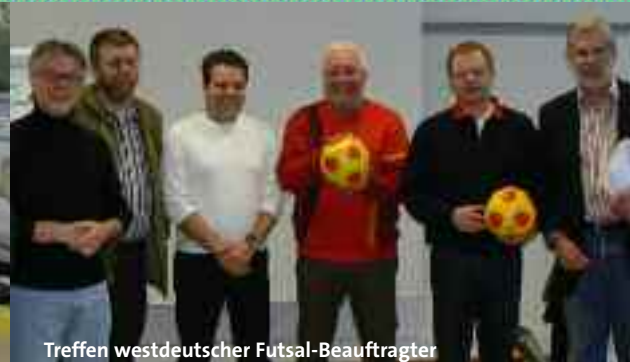
Treffen westdeutscher Futsal-Beauftragter