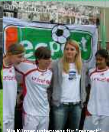
Nia Künzer unterwegs für "respect" Leichtathletik WM in Berlin