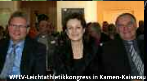
WFLV-Leichtathletikkongress in Kamen-Kaiserau