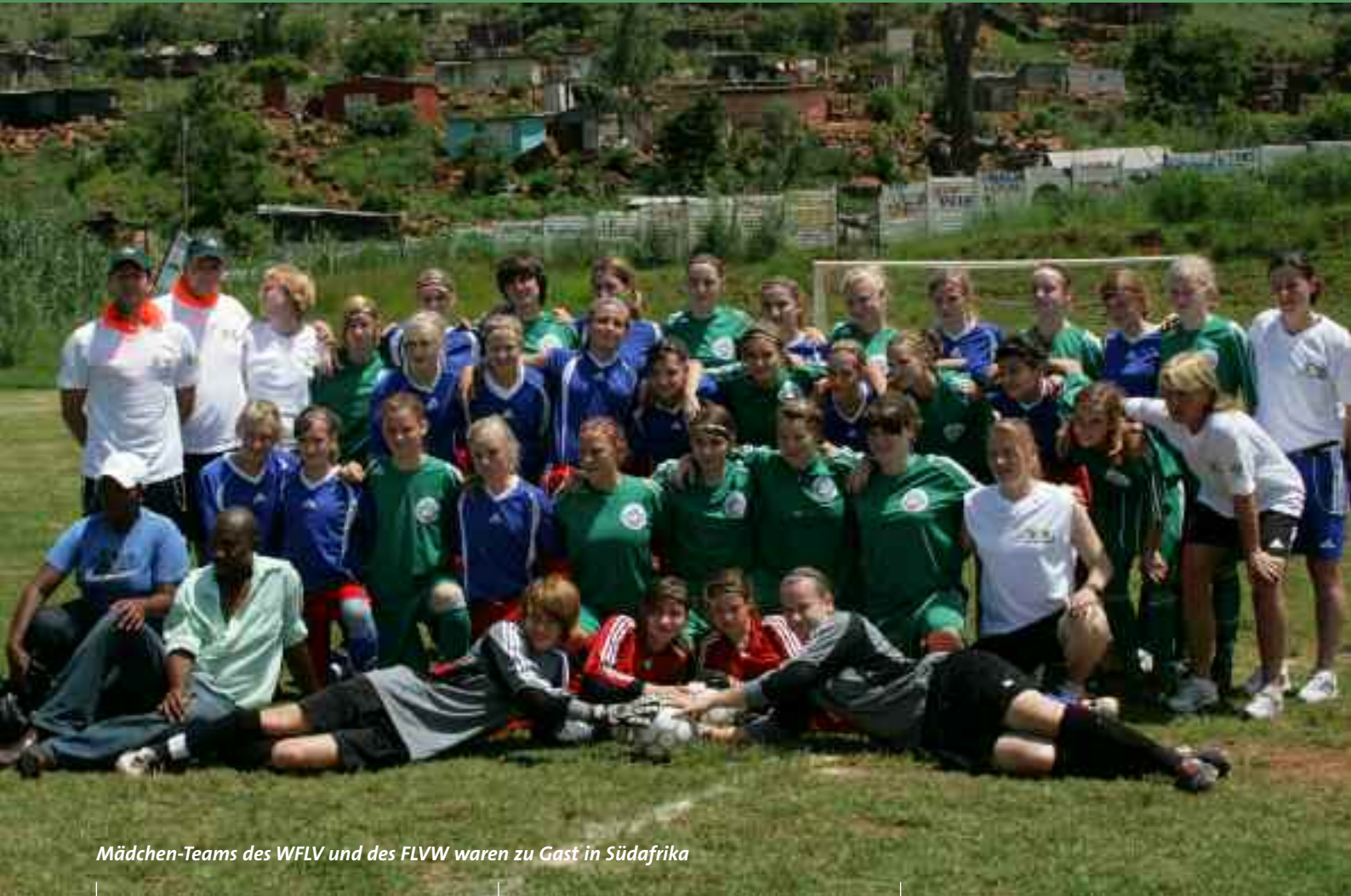
Mädchen-Teams des WFLV und des FLVW waren zu Gast in Südafrika