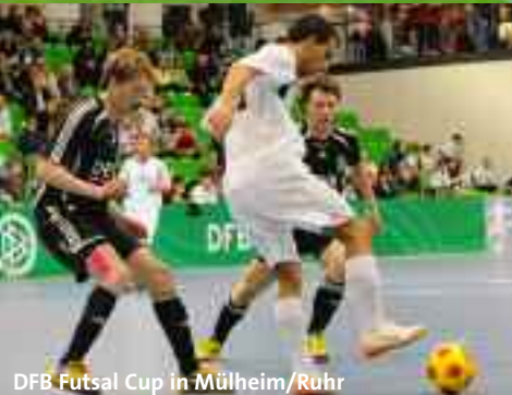
DFB Futsal Cup in Mülheim/Ruhr