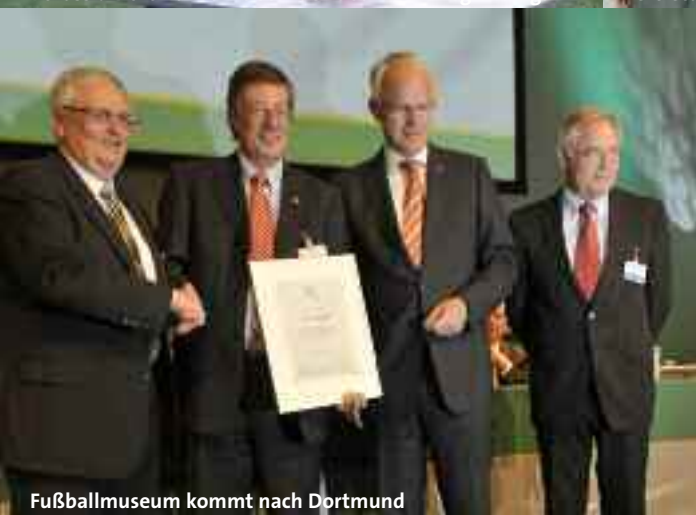
Fußballmuseum kommt nach Dortmund