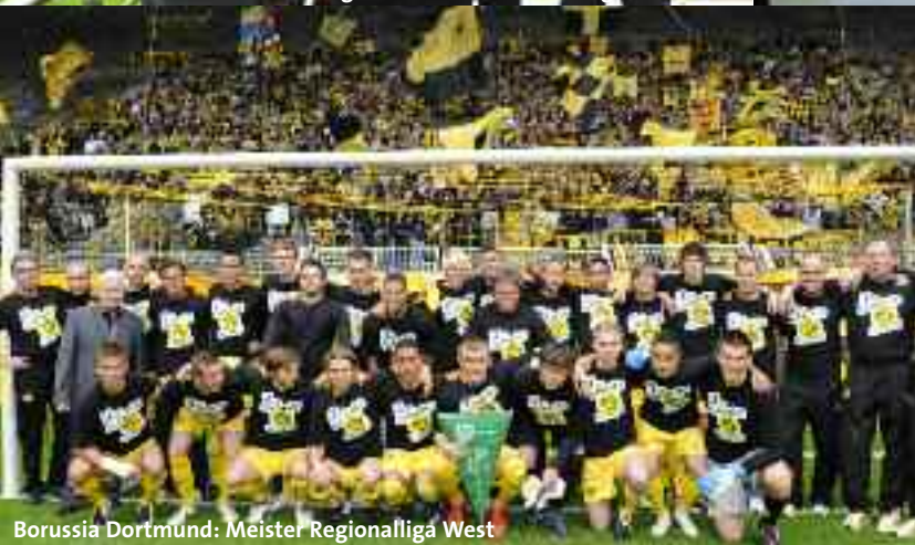
Borussia Dortmund: Meister Regionalliga West