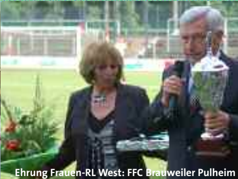
Ehrung Frauen-RL West: FFC Brauweiler Pulheim