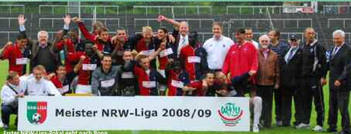
Erster NRW-Liga-Pokal geht nach Bonn