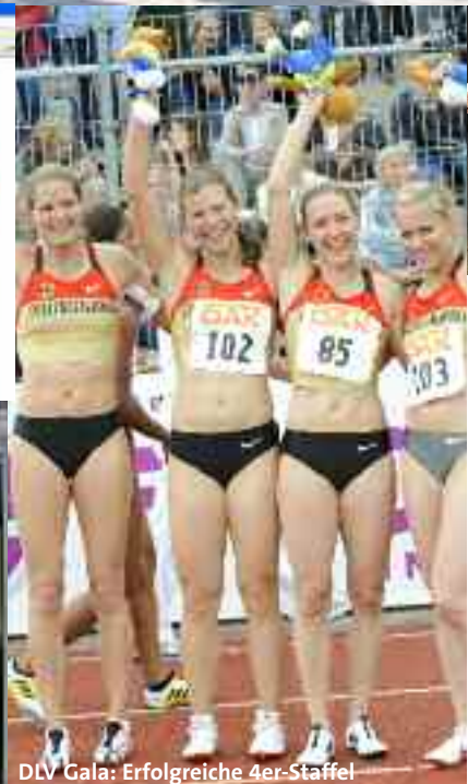
DLV Gala: Erfolgreiche 4er-Staffel