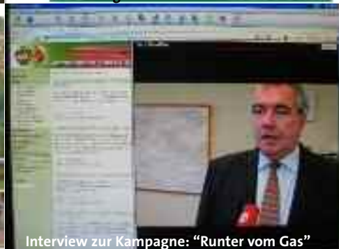
Interview zur Kampagne: "Runter vom Gas"