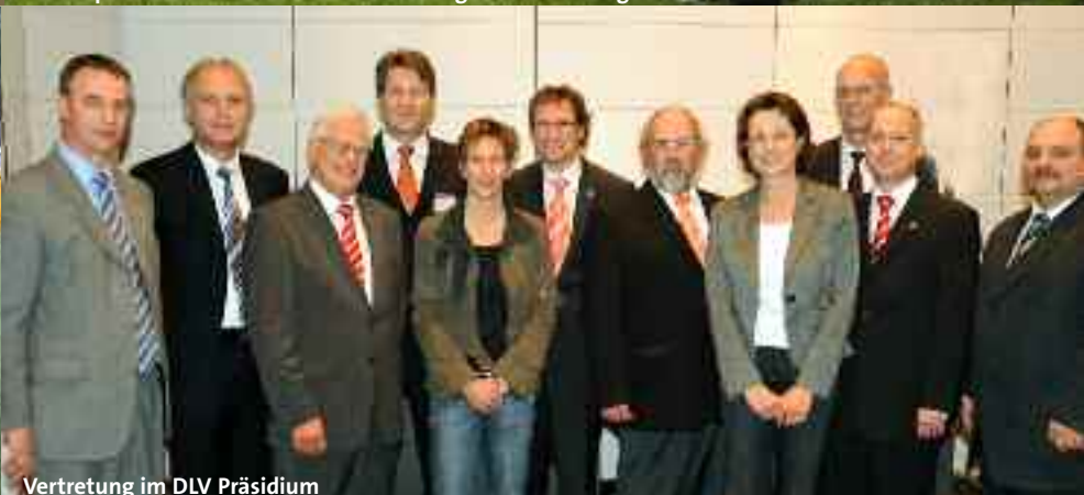
Vertretung im DLV Präsidium