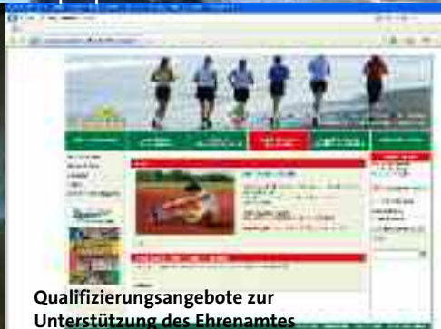
Qualifizierungsangebote zur Unterstützung des Ehrenamtes