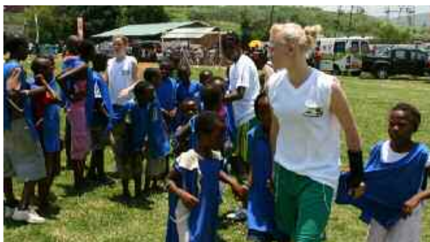
"Sports-Day": Die einheimischen Kinder konnten einen unvergesslichen Tag mit den Fußballerinnen verbringen

Alle Delegationsteilnehmer fanden es schade, dass die Zeit so schnell verging, doch weitere Kontaktaufnahmen zwischen dem WFLV und seiner Partnerprovinz Mpumalanga werden nicht lange auf sich warten lassen.