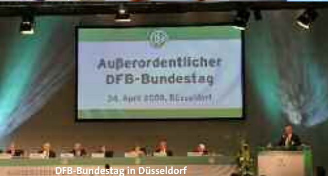
DFB-Bundestag in Düsseldorf