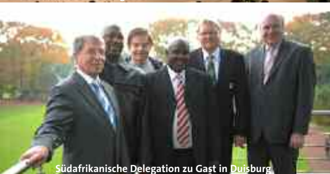
Südafrikanische Delegation zu Gast in Duisburg