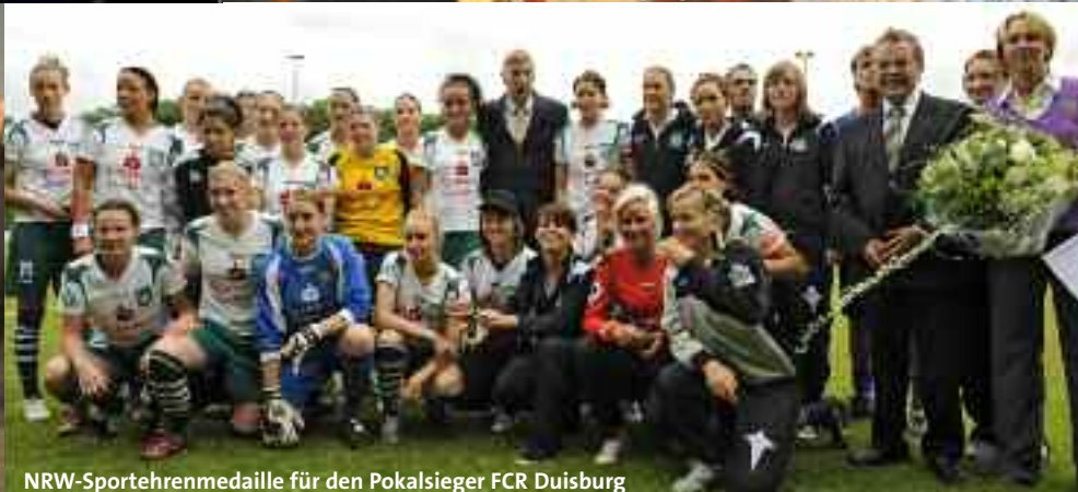
NRW-Sportehrenmedaille für den Pokalsieger FCR Duisburg