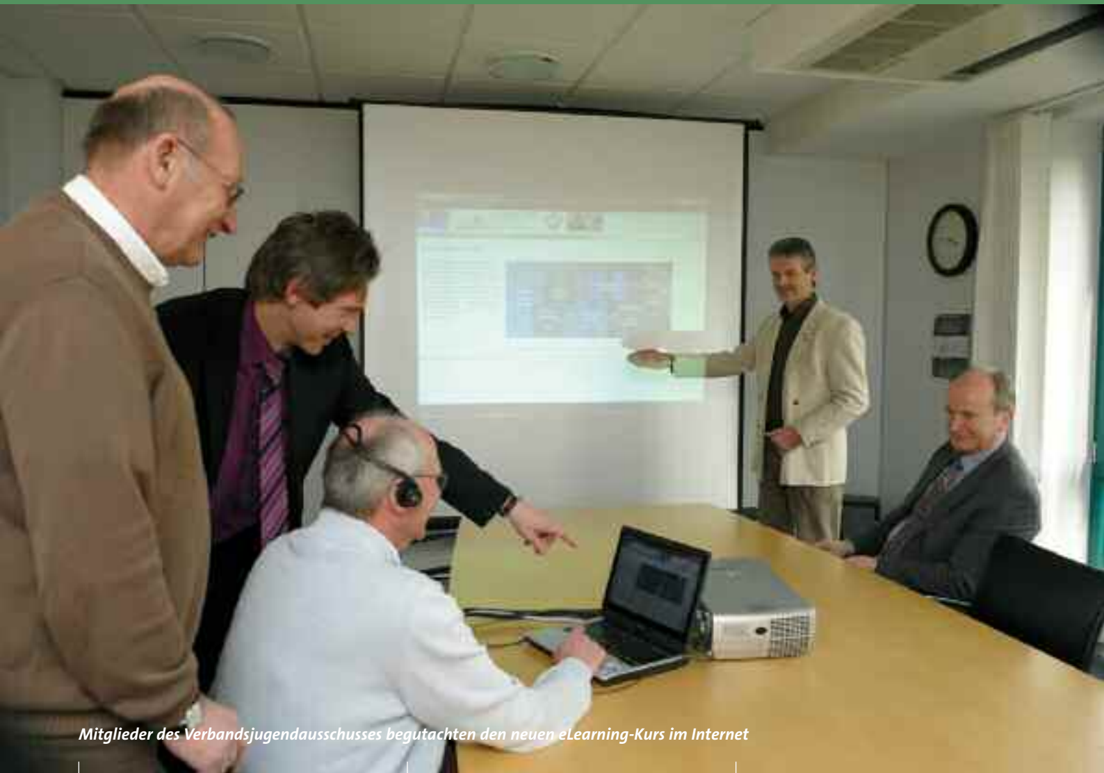
Mitglieder des Verbandsjugendausschusses begutachten den neuen eLearning-Kurs im Internet