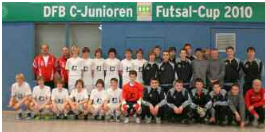
DFB C-Junioren Futsal-Cup 2010 - FC Hilchenbach und VfL Meckenheim auf den Plätzen 5 und 6