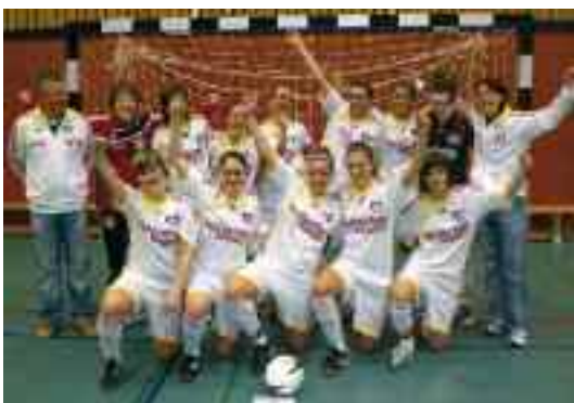
Strahlende Siegerinnen: Das Team Bayer 04 Leverkusen