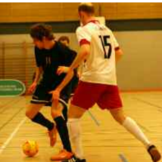
Spannendes Match zwischen Panthers Köln und MSV Hamburg